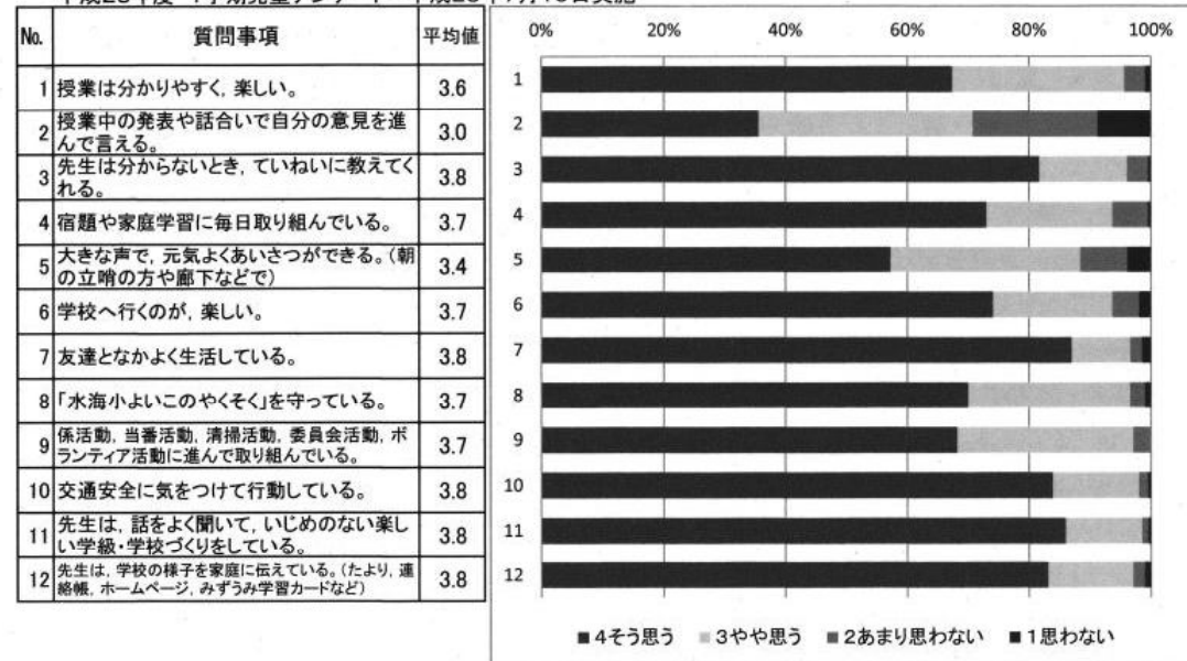
平成28年度 1学期児童アンケート 平成28年7月19日実施