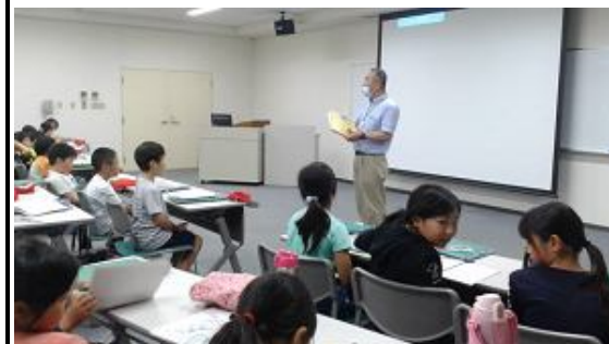
所員の方の説明を熱心に聞いていました。

6月20日(火)第4学年が坂東市にあるクリーンセンター寺久に校外学習に行きました。クリーンセンターでは、ごみを処分するための機械を見学したり、説明を聞いたりしました。子供たちは、ごみを処分することの苦勞や環境問題について理解を深めることができました。