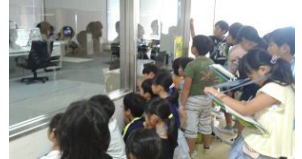
ごみを管理するためのシステムを見学