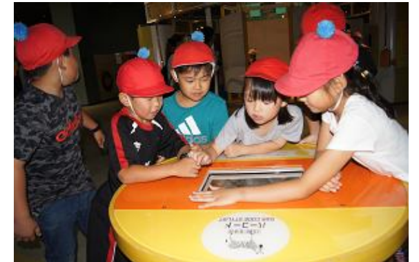
バーコードの実験をしています。