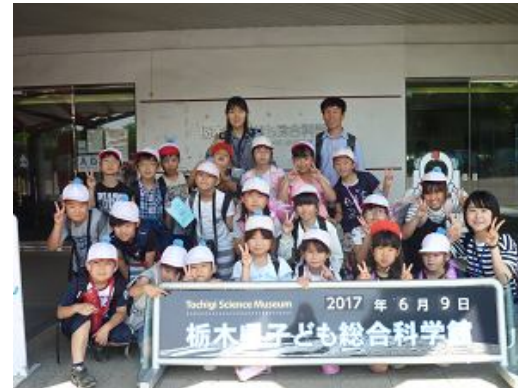
科学館に一番乗り!

6月9日(金)2年生が栃木県子ども総合科学館に遠足に行きました。科学館には水海小が一番に到着しました。科学の実験ができるコーナーがたくさんあり、子供たちは夢中になって実験をしていました。天気も良く、午後はアスレチックで元気よく遊びました。科学に親しむためのとても良い機会となりました。