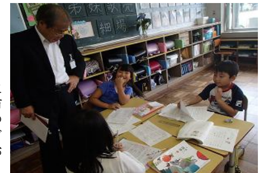
古河市教育長さんの訪問

6月はお客が多く見られました。22日(木)には県西教育事務所から、27日(火)には古河市教育委員会から、28日(水)には古河市教育長・教育部参事の方々がお見えになり授業の様子を参観されました。どのお客様からも「子どもたちが落ち着いて学習に取り組んでいる」とお褒めの言葉をいただきました。