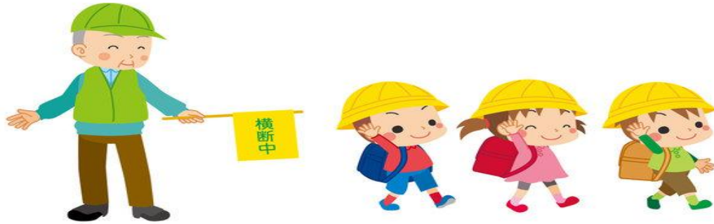
地域見守り応援隊 (水海小未来プロジェクト)